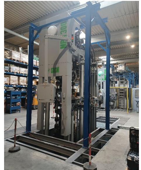
Vykládka výše zobrazeného 300t lisu SACMI, pro jehož umístění do provozu musela být otevřena střecha