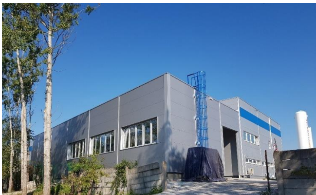
Nová výrobní hala – pohled zvenku