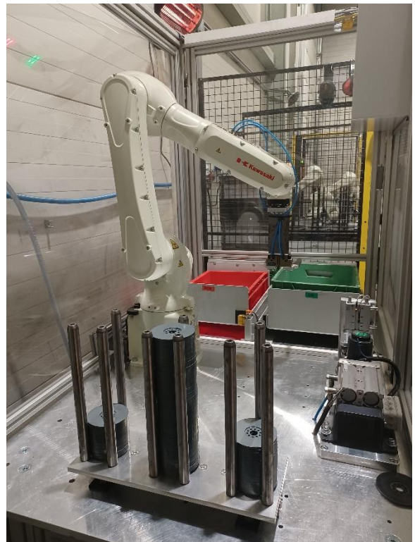
Nová automatická linka a robot Kawasaki