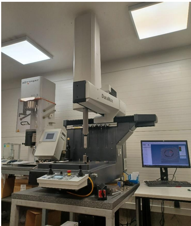
Nová řada 3D měřicího stroje Zeiss-Duramax